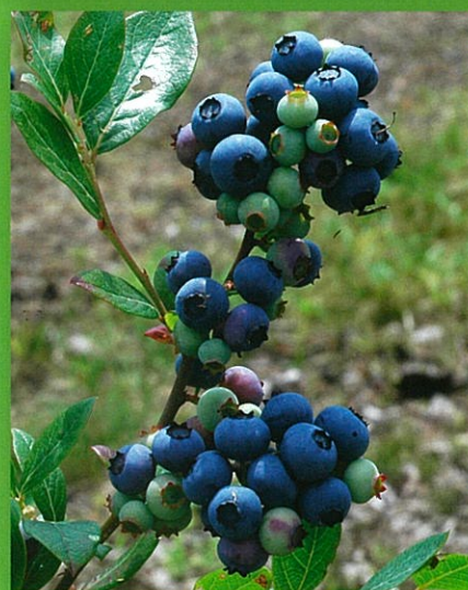
たわわに実った大粒のブルーベリー

ご自身で摘み取ってお持ち帰りできます。 お土産用パック(別売30円)もあります。 ※このチラシをご持参頂ければパックは無料です。